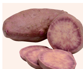
Sakura (8) 🌱