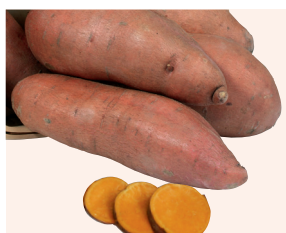
Evangeline (3) 🌱