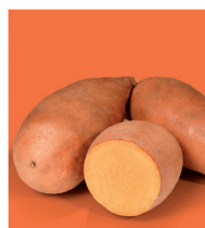
Bellevue (2) 🌱