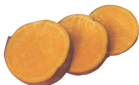
Orléans (1) 🌱