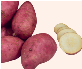
Murasaki 29 (7) 🌱