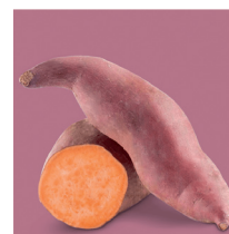
Bayou Belle (5) 🌱